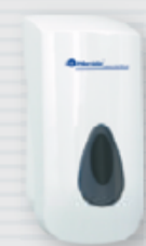
● symbol DN2TS