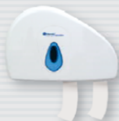
symbol PT4TN ●