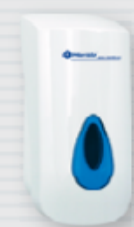
symbol DN2TN ●