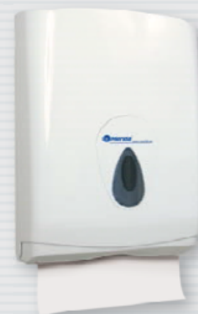
● symbol PZ1TS