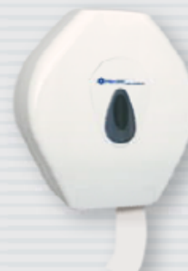
● symbol PTOTS