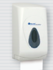
● symbol PT3TS