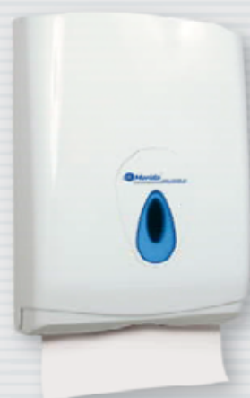
symbol PZ1TN ●