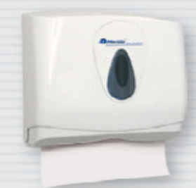
● symbol PZ2TS