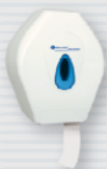
symbol PT2TN ●