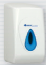
symbol M55T ●