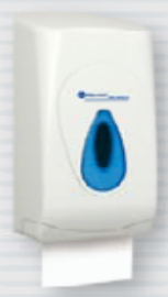
symbol PT3TN ●