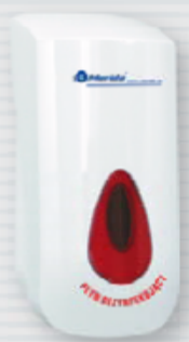
symbol DS1TC ●