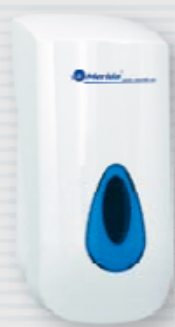
symbol DN1TN ●