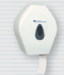
● symbol PT2TS