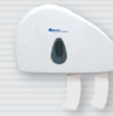
● symbol PT4TS