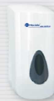
● symbol DN1TS