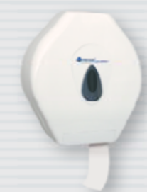
● symbol PT1TS