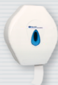
symbol PT1TN ●