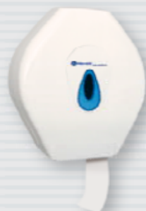
symbol PTOTN ●

w opakowaniu załączone dwa ozdobne okienka