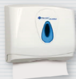
symbol PZ2TN ●